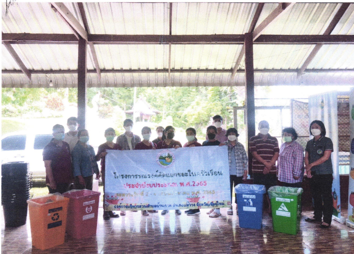
ภาพประกอบ “โครงการรณรงค์คัดแยกขยะในครัวเรือน”